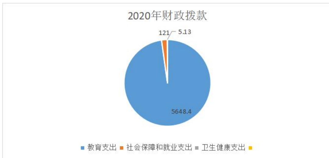
财政拨款支出决算结构（按功能分类）

2020 年度财政拨款支出 5774.53 万元，主要用于以下方面：教育（类）支出 5648.4 万元，占 97.82%；社会保障和就业（类）支出 121 万元，占 20.95%；卫生健康支出 5.13 万元，占 0.08%。