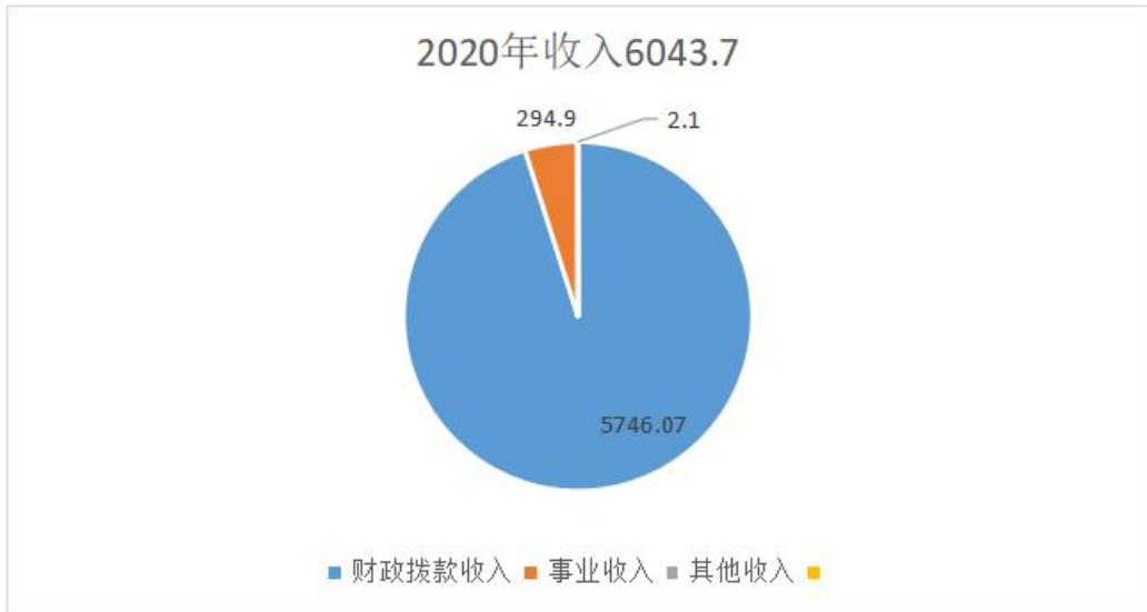
图 X：收入决算构成情况