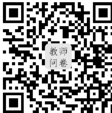
教师问卷入口二维码