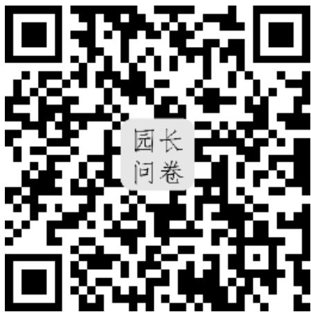
园长问卷入口二维码